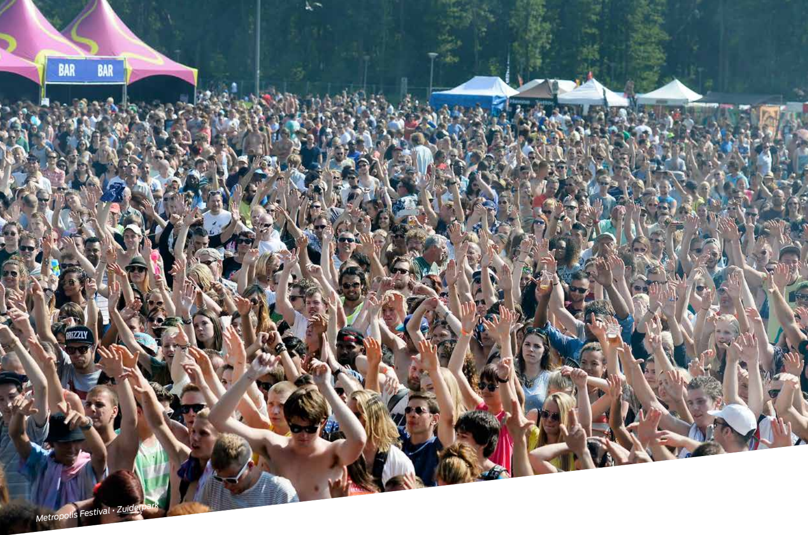
Metropolis Festival - Zuiderpark