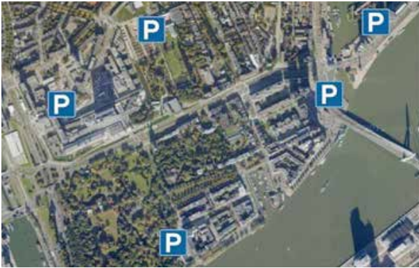
Figuur 1: Parkeergarages in de directe omgeving van de Parklaan