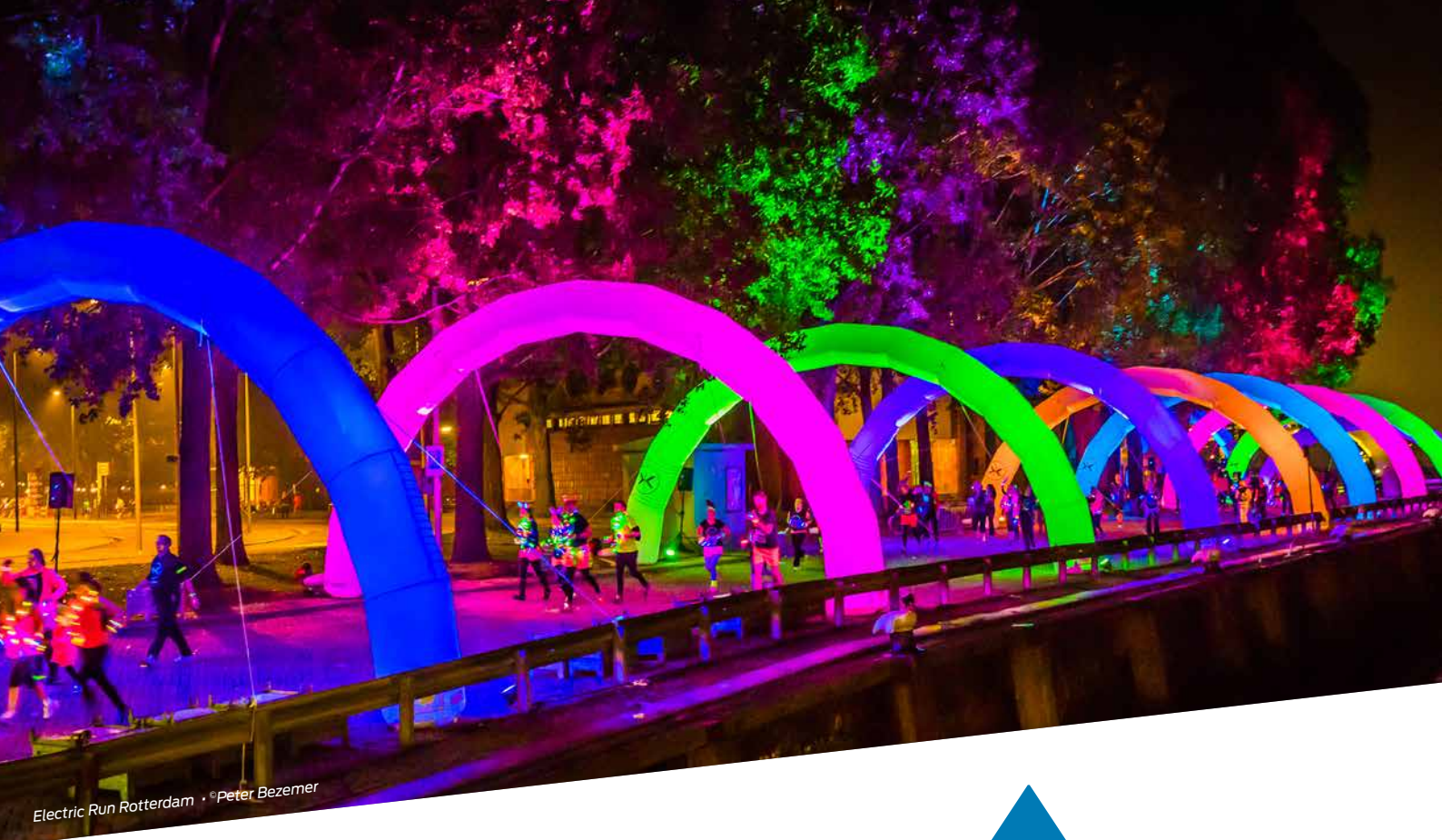
Electric Run Rotterdam • ©Peter Bezemer