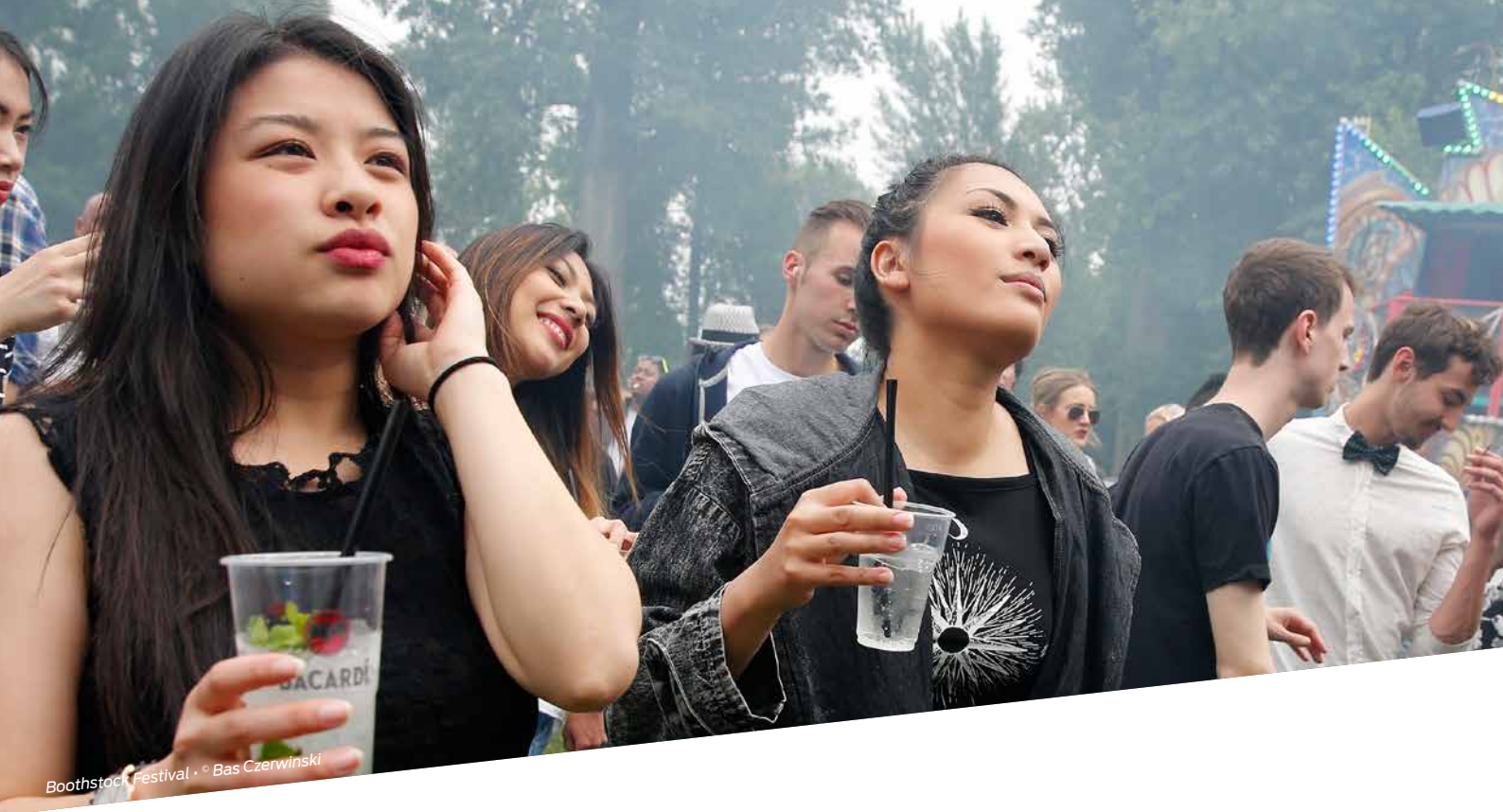
Boothstock Festival • © Bas Czerwinski