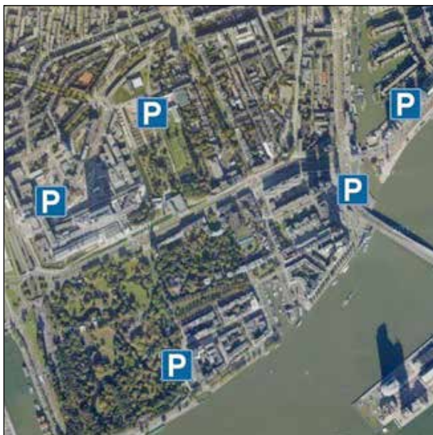
Figuur 4: Parkeergarages in de directe omgeving van Het Park.