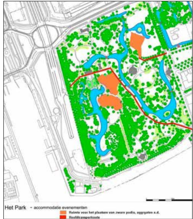
Figuur 3: Padenhiërarchie Het Park.