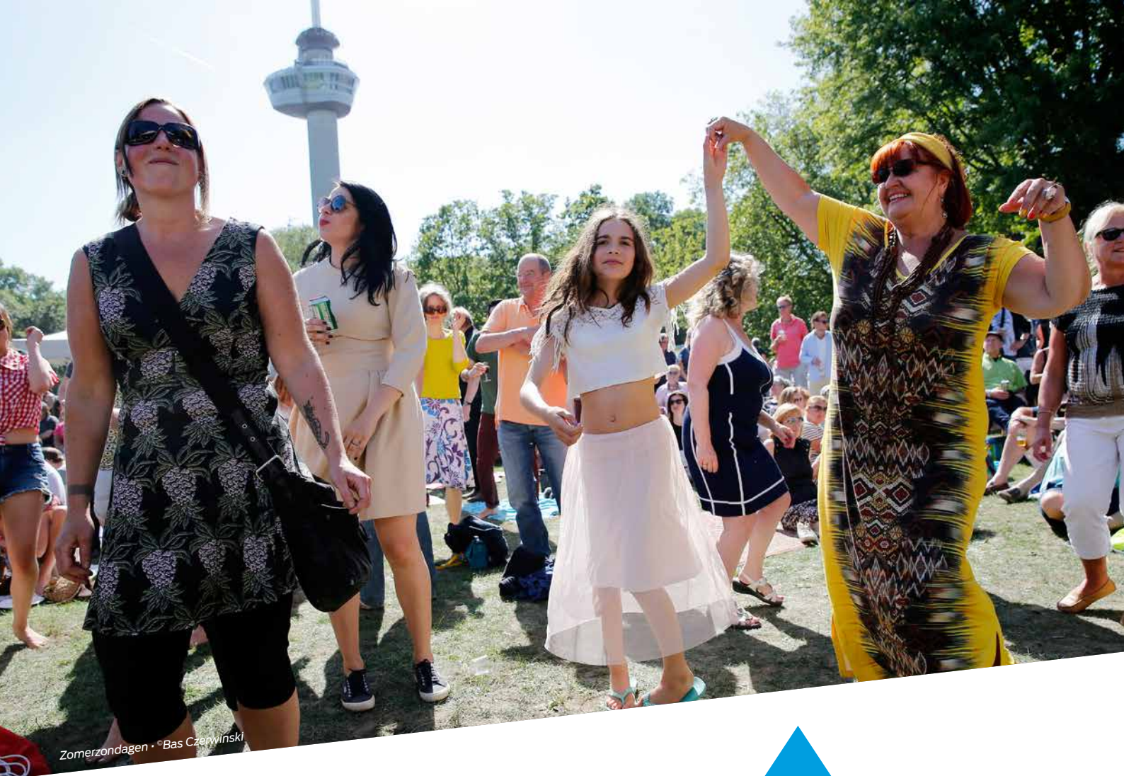
Zomerzondagen • Bas Czerwinski