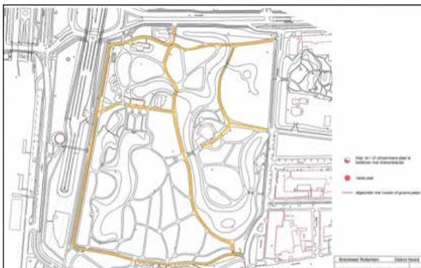
Figuur 2: Calamiteitenroutes in Het Park.