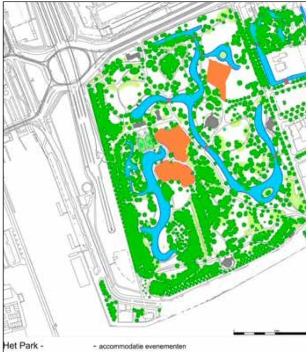
Figuur 1: Accommodatie evenementen in Het Park. De oranje delen zijn de verstevigde delen van Het Park.